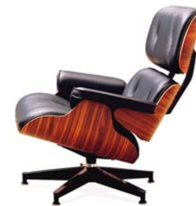
Кресло Eames Lounge

Проектируя этот «комплекс», Эймсы прошли длинный путь экспериментов. Для амортизации комплекса соединений спинка — сидение использовали резиновые шайбы, вмонтированные в корпус кресла. При использовании они обеспечивали невиданный до этого комфорт и адаптацию кресла под тело. Другое творческое использование материалов — в подушках сидений. Отказавшись от стандартного крепления обивки на гвоздях, Эймсы применили соединение на молнии вокруг внешнего края. Сейчас это обычная практика для креплений обивки мягкой мебели, для 1956 года — Революция.