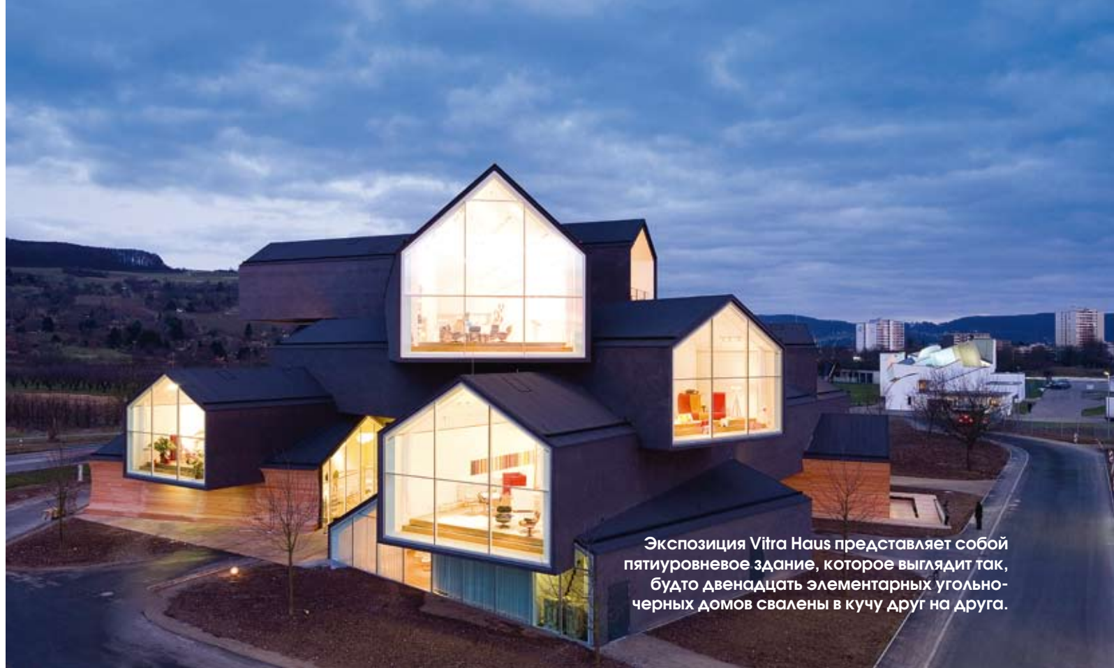
Экспозиция Vitra Haus представляет собой пятиуровневое здание, которое выглядит так, будто двенадцать элементарных угольно-черных домов свалены в кучу друг на друга.