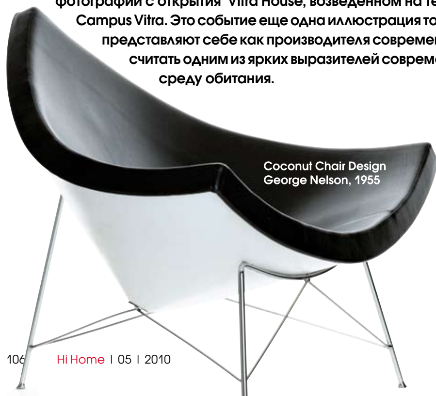
Coconut Chair Design George Nelson, 1955

В марте 2010 года едва ли не все интерьерные и архитектурные издания и блоги печатали статьи и фотографии с открытия Vitra House, возведенном на территории архитектурного комплекса Campus Vitra. Это событие еще одна иллюстрация того, что компанию Vitra, которую многие представляют себе как производителя современных стульев, в действительности стоит считать одним из ярких выразителей современных дизайнерских воззрений на всю среду обитания.