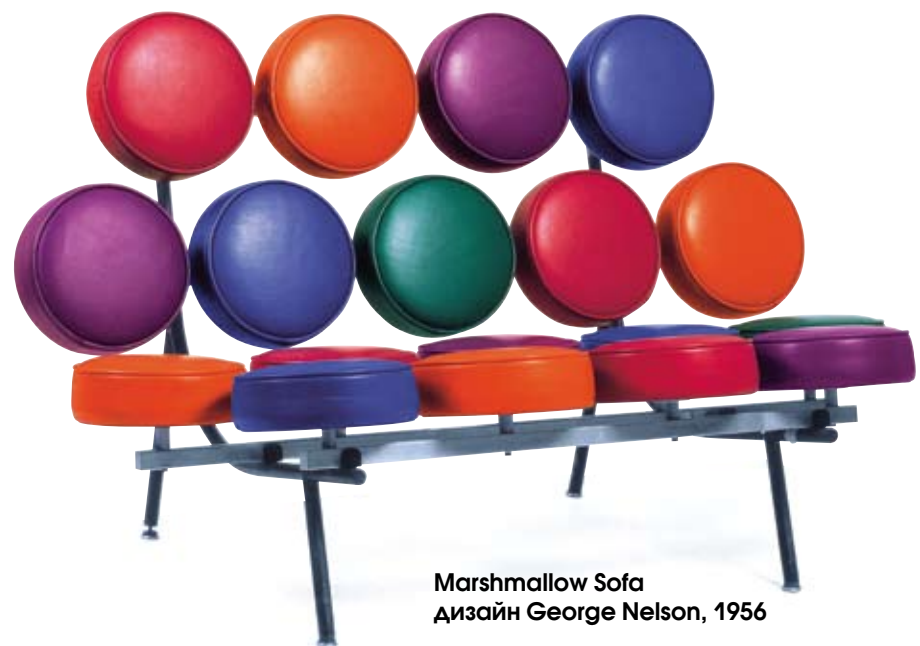
Marshmallow Sofa дизайн George Nelson, 1956