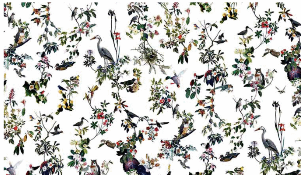
MAHARAMPRE Francesco Sim © 2010. Maharam under license Campus Event, 20 © Vitro (www.vitra.com)

В основе панно «Renard 2» голландского графического дизайнера Хармена Лимбурга (Harman Lieburg) лежат архивные эстампы, которые автор оцифровал, чтобы создать современную композицию. ©