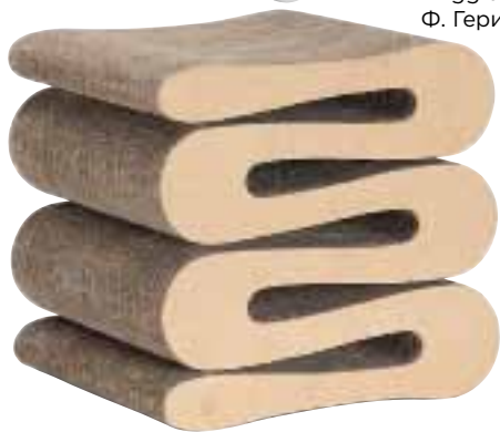
Wiggle Stool, диз. Ф. Гери. 1972.