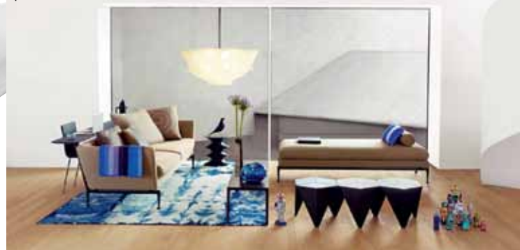
Suita Sofa, диз. А. Читтерио. 2010.