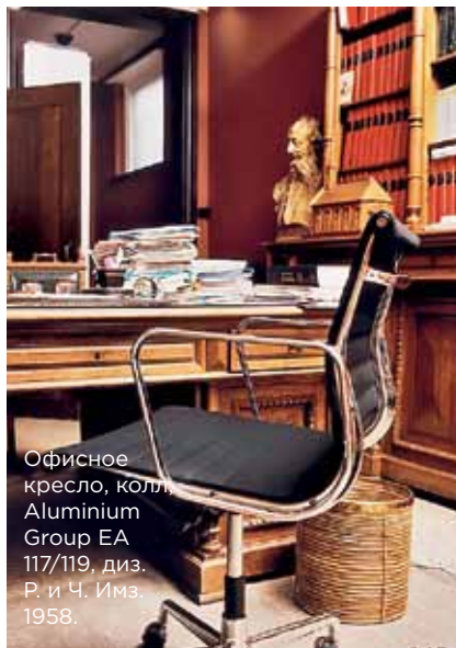
Офисное кресло, коллекция Aluminium Group EA 117/119, диз. Р. и Ч. Имз. 1958.