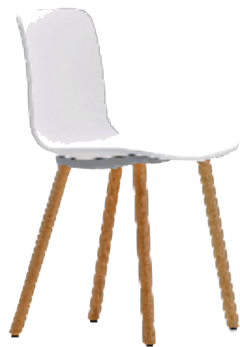
Стул Hal, диз. Дж. Моррисон. 2010.