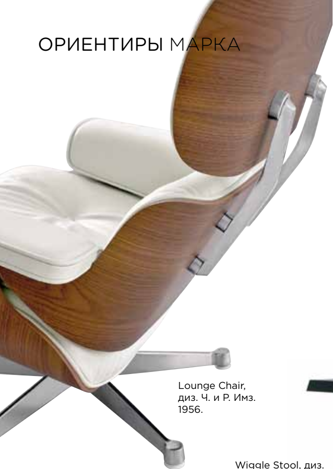
Lounge Chair, диз. Ч. и Р. Имз. 1956.