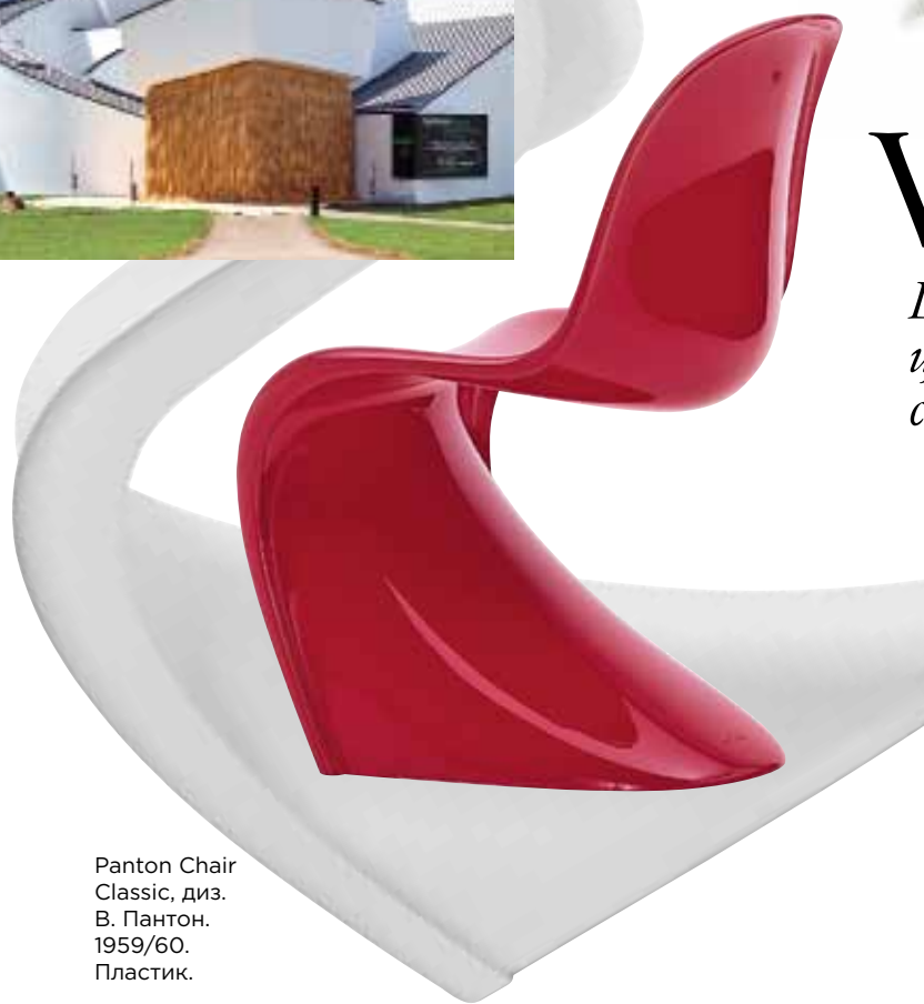
Panton Chair Classic, диз. В. Пантон. 1959/60. Пластик.

Швейцарская компания учит ценить модернистский дизайн и современную архитектуру.