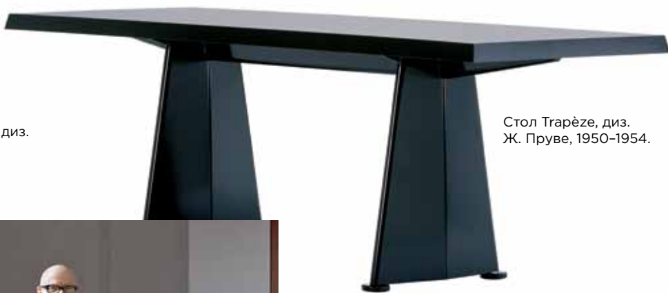
Стол Trapèze, диз. Ж. Пруве, 1950–1954.