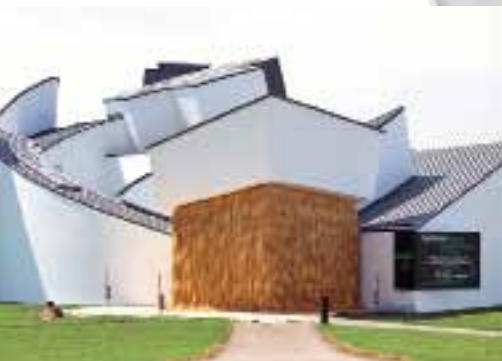
Vitra Design Museum, арх. Ф. Гери. 1989.