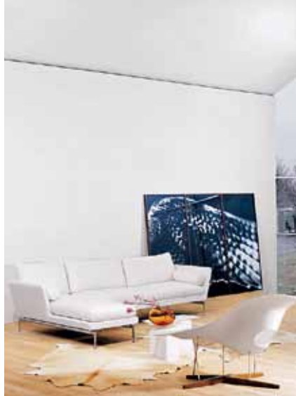
Диван Suita, диз. А. Читтерио. 2010. Стул La Chaise, диз. Ч. и Р. Имз. 1958.