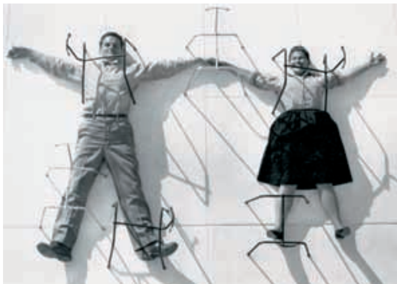
Чарлз и Рей Имз, одетые в одинаковые клетчатые рубашки, в металлической конструкции на тротуаре перед своим офисом (Вашингтон-бульвар, 90) в Лос-Анджелесе. 1947 г.

Главная работа начиналась по ночам в ванной комнате их съёмной квартиры. Они экспериментировали с той самой клеёной фанерой, которую Чарлз использовал для изготовления мебели (стульев, кресел, ширм), скульптуры, игрушек. Об этом стало известно главе мебельной фирмы Генри Миллеру, вскоре решившему запустить эти изделия в производство.