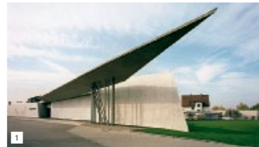
1 Русские супрематисты Казимир Малевич и Эль Лисицкий вдохновляли мало кому известную в начале 1990-х англичанку иракского происхождения Заху Хадид во время работы над проектом пожарной станции для Vitra Campus

Новый магазин Музея дизайна расположился на первом уровне Vitra Haus . Главный товар — точные миниатюрные реплики объектов из коллекции музея, выполненные из материалов и по технологиям оригиналов. Миниатюры сделаны в масштабе 1:20. Их высота — 5–15 см, цена — 90–500 евро. Любой предмет, выставленный в шоу-румах Vitra Haus , можно заказать через терминалы с помощью электронной карточки, которую выдают каждому посетителю при входе. Покупки в онлайн-музейном магазине можно сделать на соответствующей странице — www.design-museum.com/index.php