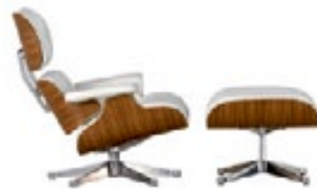
Лаунж-кресло Чарлза и Рей Имз

В павильоне, построенном Фрэнком Гери для музейного магазина, недавно открылось Vitra Atelier — настоящий «храм лаунж-кресла Чарлза и Рей Имз», их шедевра 1956 года. Из закрытых производственных помещений сюда перенесли мастерскую, из музея — документы, эскизы, фотографии.