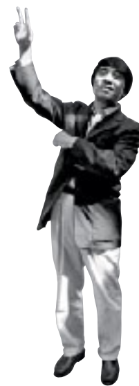
Бывший водитель грузовика, архитектор-самоучка Тадао Андо построил в Vitra Campus Павильон для конференций