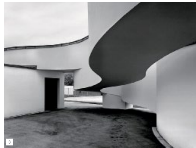
3 Стена одного из фабричных корпусов, построенного в Вайль-на-Рейне Фрэнком Гери, — настоящий архитектурно-дизайнерский шедевр, непохожий на традиционную промышленную архитектуру